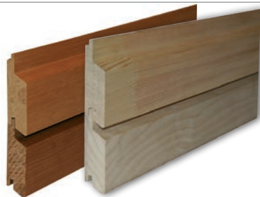
Rhombusleiste – mit Nut und Feder