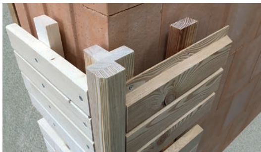
Die perfekte Ecklösung