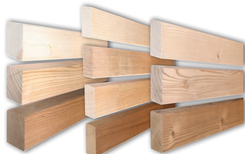
Rhombusleiste – 4-seitig trapezförmig gehobelt

Varianten mit anderen Holzarten oder anderen Aufbauten nach Anfrage möglich. Wir garantieren gleich bleibend hohe Produktqualität durch eigene Herstellung, Qualitätsmanagement-System sowie Fremdüberwachung, vom Sägewerk bis zur Verarbeitung im Leimholzwerk. Qualität: Laut Sortierungsbestimmungen Holz Schiller.