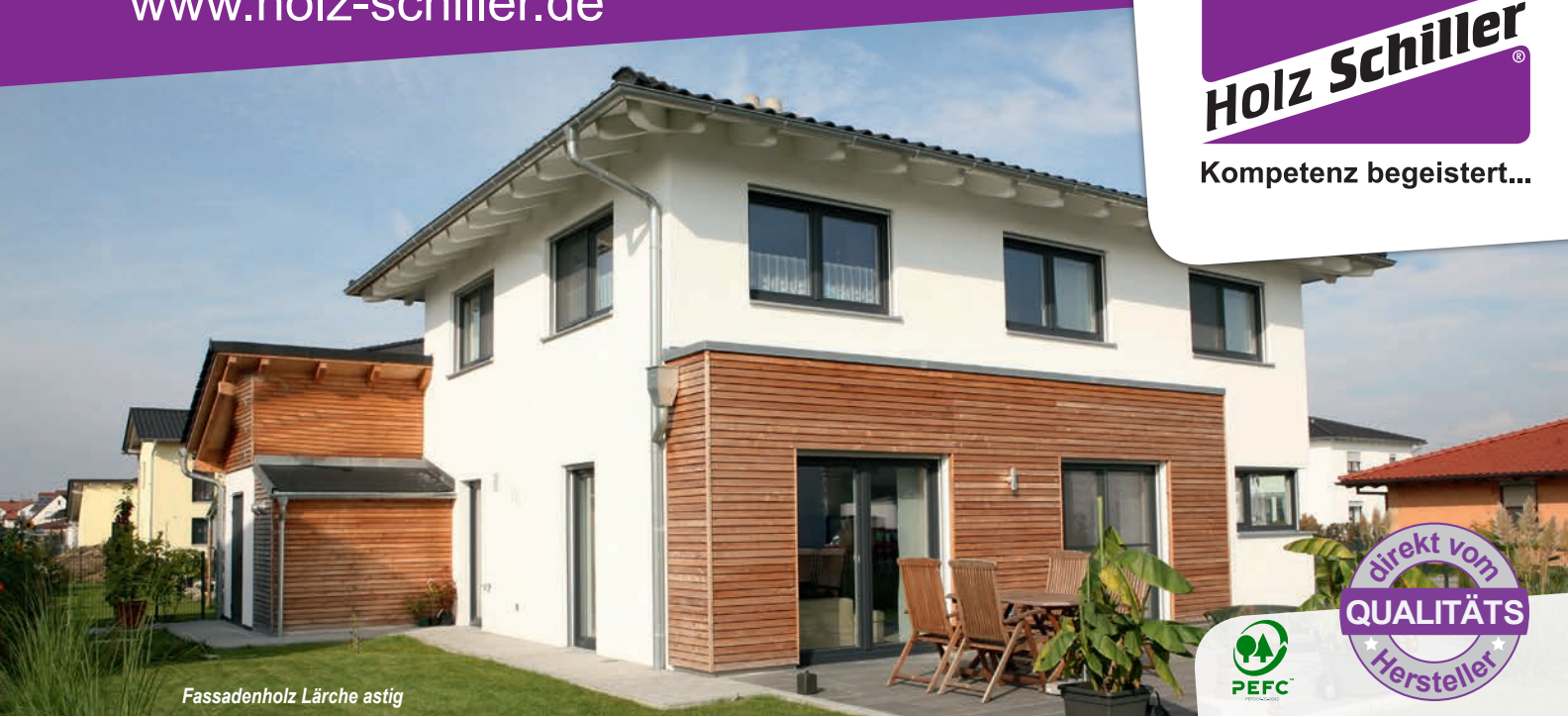
Fassadenholz Lärche astig