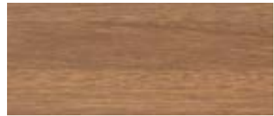
Meranti (nicht PEFC zertifiziert)