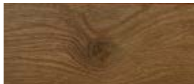
Eiche antik astig