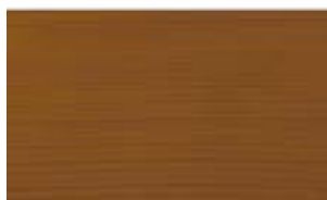
OCODURA - Kiefer