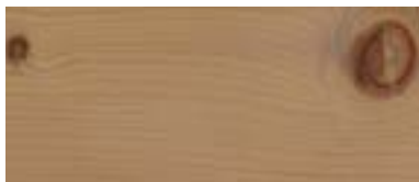
Fichte antik astig