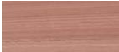
Red Grandis (FSC zertifiziert)