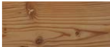
Lärche antik astig